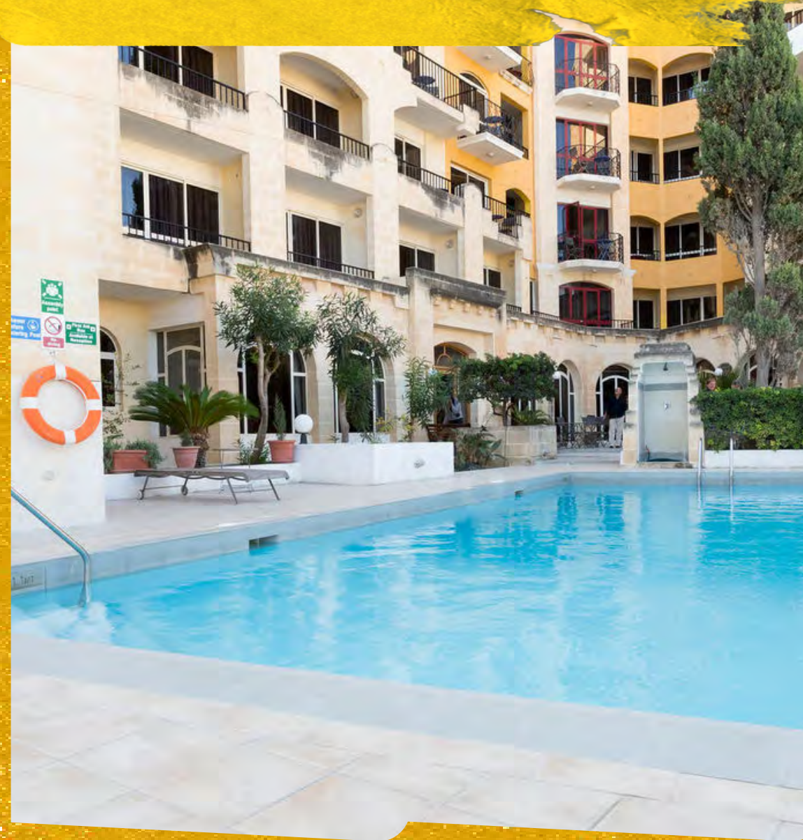
IL PALAZZIN ★★★★★