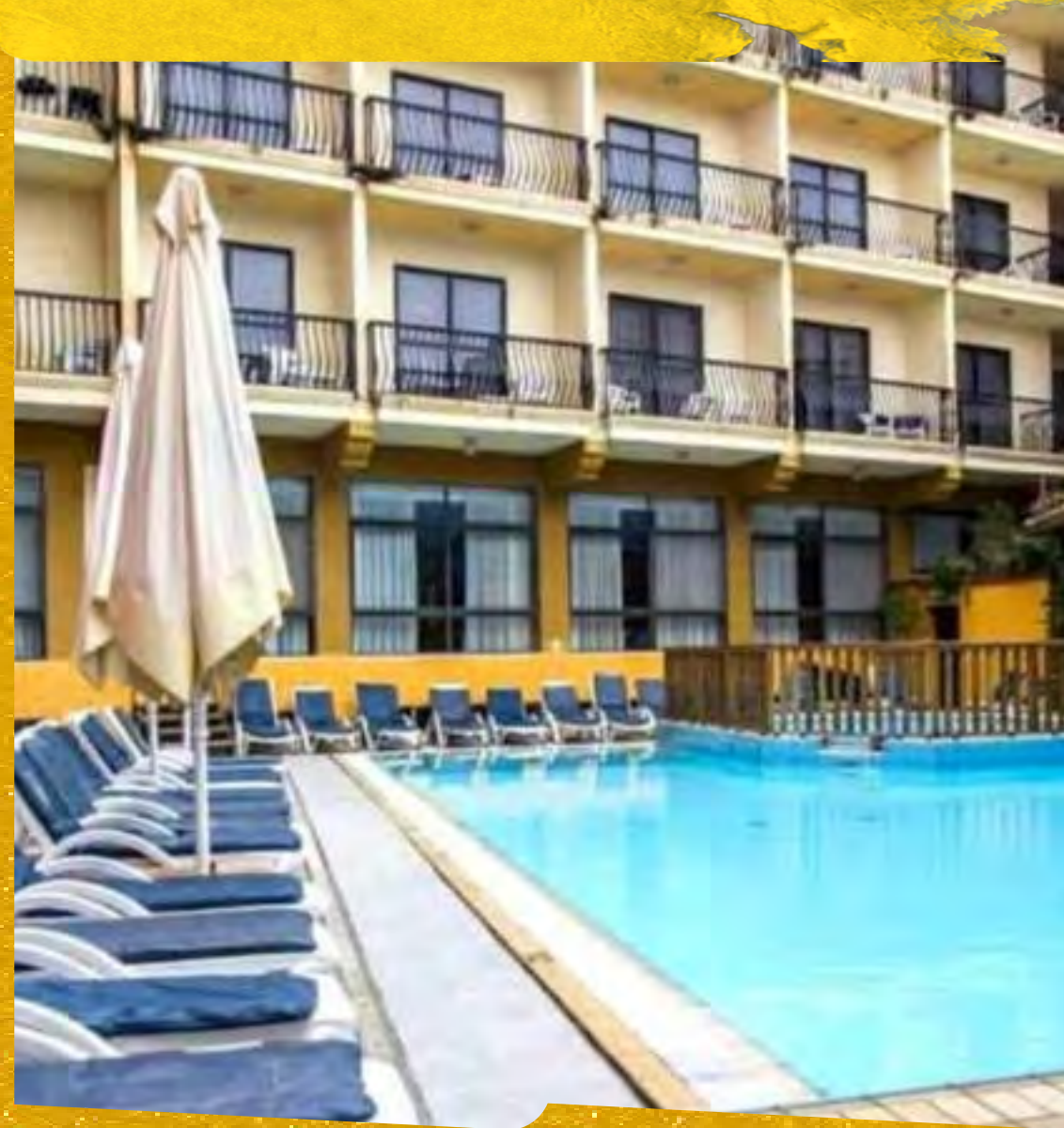
BELLA VISTA ★★★★★